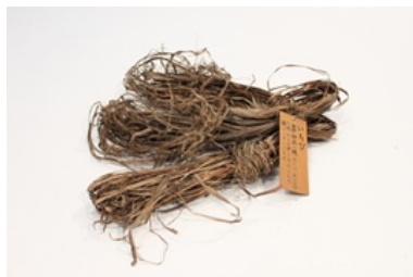
イチビの繊維

日本には東回りと西回りの二種類のイチビが存在しています。インド原産のイチビは、どのような道の手を経て当園にたどり着いたのでしょうか？