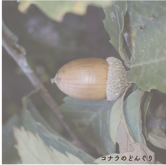
コナラのどんぐり