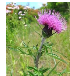
ノザミ (野薊) B5 5月29日~6月17日