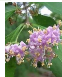
ムラサキシキ (紫式部) A4、B5、C4 5月29日~6月23日