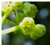
ゴンズイ: A4、A5、B4 A4、A5、B4