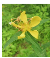
トモエノウ (巴草) 第一隣公園 6月23日~7月5日