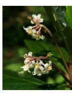
カラタチバナ (唐橘) G3 6月17日~6月25日