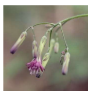
ムラキニガナ (紫苦菜) D3 6月17日~6月23日