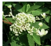
リウツギ (糊空木) G2 確認できず