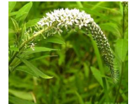
ノジトラノ (野路虎尾) B5、C5 6月12日~7月12日