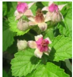
ナadeshiko (雛代草) A2、A4、B5 5月17日~7月5日