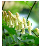
クララ (眩草) B4、B5 5月20日~6月12日