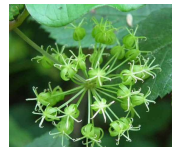
シオダ (牛尾菜) B2、E2 6月12日~6月23日