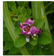
マルバンハギ (円葉萩) B5、C5 6月25日~9月19日