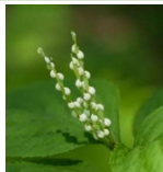
フシズカ (二人静) a4、F2 5月24日~6月1日