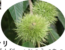
クリ ブナ科 Aお,Bえ,Cあ,Dい