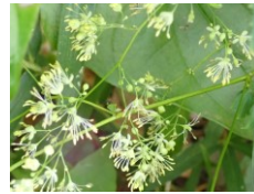
アキカラマツ キンポウゲ科 Cえ