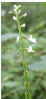
ハエドクソウ ハエドクソウ科 B~Dえ,Bあ