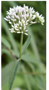
オオヒヨドリバナ キク科 Bえ,Cえ,Dお