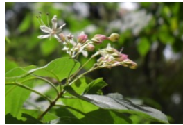
クサギ シソ科 Dう,Cお,Dお