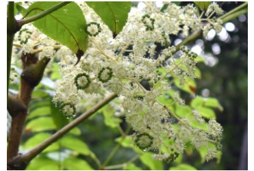
タラノキウコギ科 Bえ,Cえ