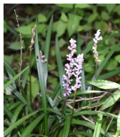
ヤブラン キジカクシ科 Fい