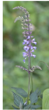
アキノタムラソウ シソ科 Dう,Iえ