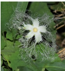
カラスウリウリ科 開花は夜間 Bあ,Aう