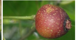
イヌビワ 左：雌株の果囊 右：雄株の花囊 クワ科 Iう