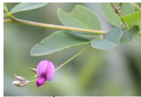
ヤマハギ マメ科 Cえ