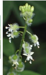
ミズタマソウ アカバナ科