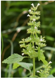
イヌトウバナ シソ科 Cえ