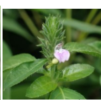
キツネノマゴ キツネノマゴ科 Bあ,Bえ