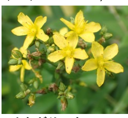
オトギリソウ オトギリソウ科 Aう,Cえ