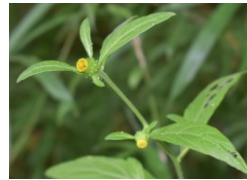
ガクビソウ キク科 Cあ,Cえ