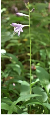
コバギボウシ キジカクシ科 Dい,Dう