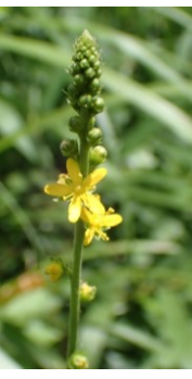
キンミズヒキ バラ科 Bあ,Cえ,Dう