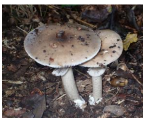
テングタケの仲間