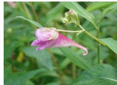
ワタラセツリフネソウ