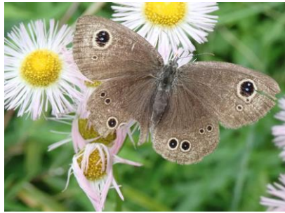
ヒメウラナミジャノメ