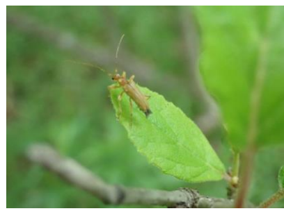
カミキリモドキの仲間