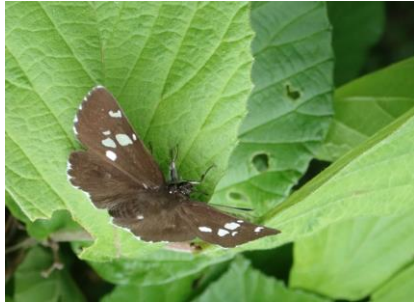
ダイショウセセリ