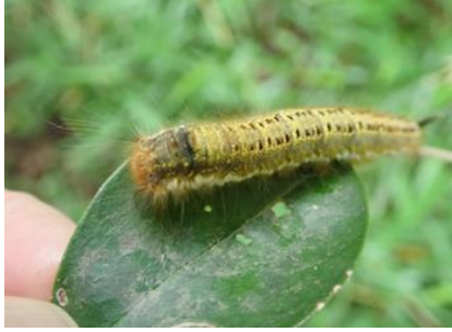
タケカレハの幼虫