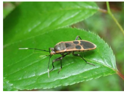
オオホシカメムシ