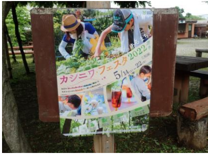
カシニワ・フェスタ

5組8名の方々に季節の植物や昆虫など自然の豊かさを楽しんで頂けたと思っています。