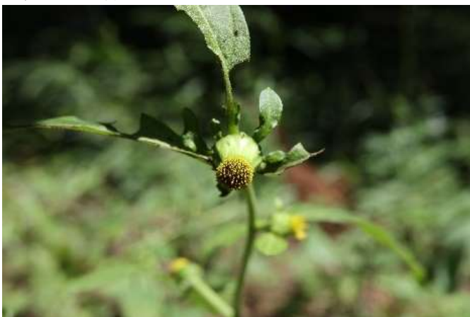
ガンクビソウ(雁首草): キク科 8月初～9月末(8月21日)