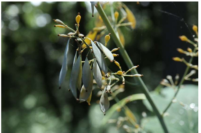
タケニグサ(竹似草): ケシ科 7月初～7月末(7月17日)