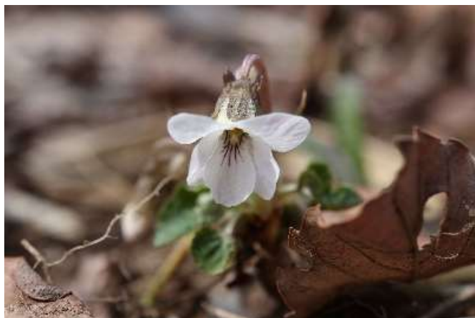
マルバスマレ(丸葉堇): スミレ科 4月初~4月末(4月5日)