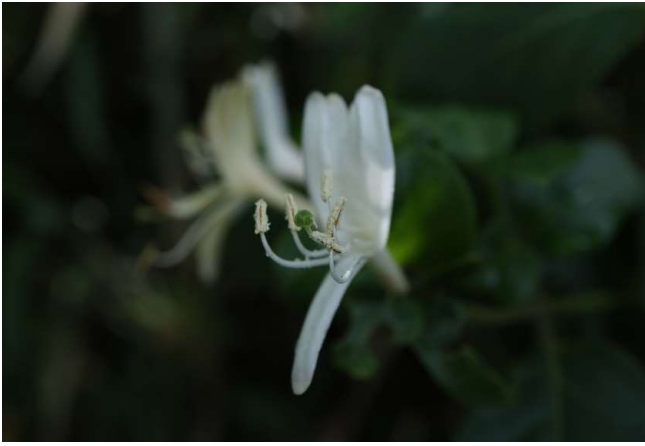
オオヒョウタンボク(大瓢箪木): スイカズラ科 (5月22日)