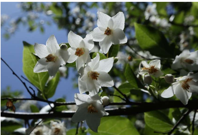
エゴノキ: エゴノキ科 5月中～6月初(5月16日)