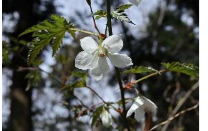
モミジイチゴ(紅葉苺): バラ科 3月中~4月初(4月5日)