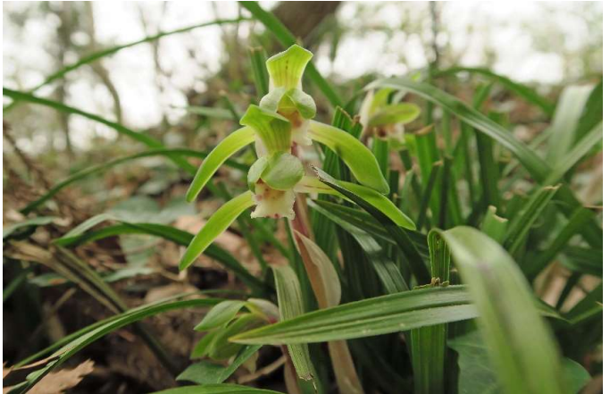
シュンラン(春蘭): ラン科 3月初~4月中(3月20日)