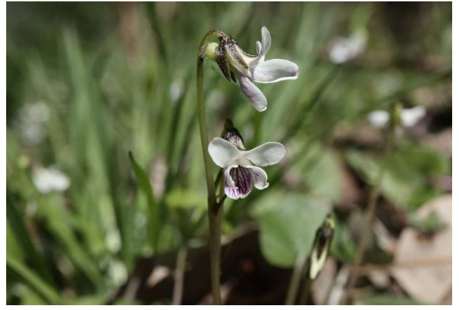
アギスマレ(顎董): スミレ科 4月初～5月中(4月15日)