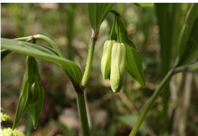
ホウチャクソウ(宝鐸草): イサフラン科 4月初～5月末(4月29日)