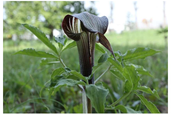
マムシグサ(蝮草): サトイモ科 4月末～5月中(4月29日)