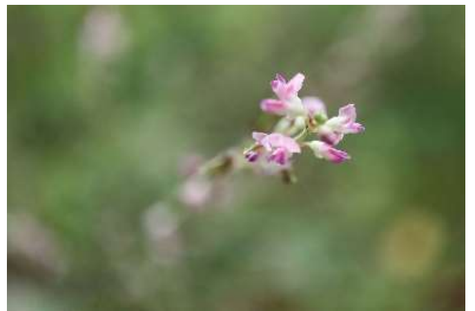
ヤスビトハギ(盗人萩): マメ科 9月初～9月末(9月19日)