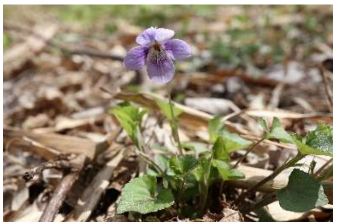
アカフタチボスマレ(赤斑立坪堇): スミレ科 4月初~4月末(4月5日)