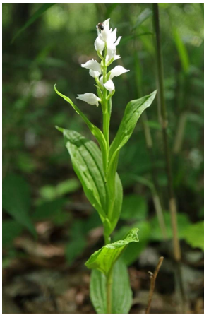
ギンラン(銀蘭): ラン科 4月末～5月中(5月5日)