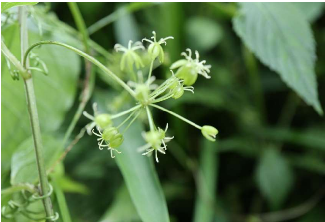
シオデ(牛尾菜): サルトリハバ科 6月中～7月中(6月25日)