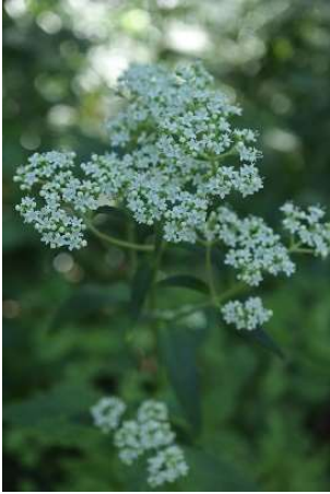
オトコエシ(男郎花): オミナエシ科 8月中～9月末(9月6日)