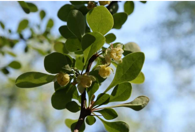
メギ(目木): メギ科 4月初～4月末(4月12日)