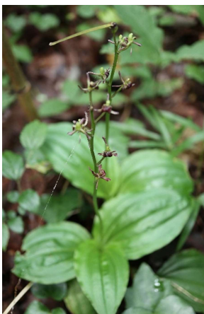
コクラシ(黒蘭): ラン科