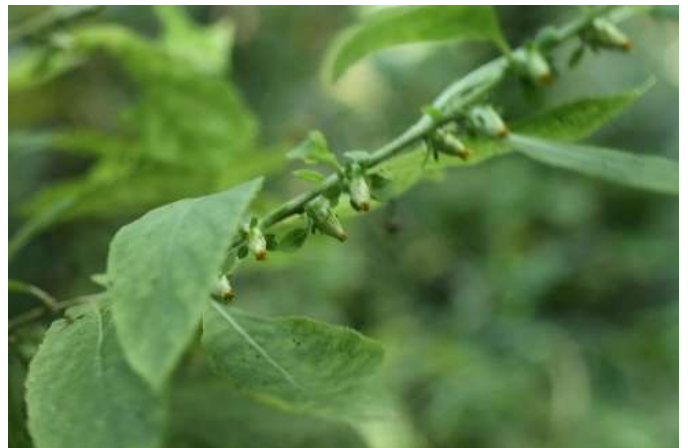
ヤブタバコ(藪煙草): キク科 9月初～9月末(9月19日)