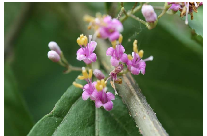
ムラサキシキブ(紫式部): シソ科 5月末～6月末(6月1日)