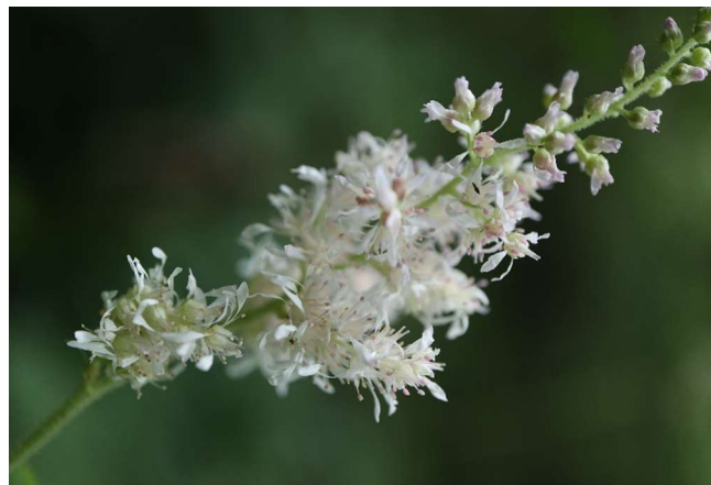
チダケサシ(乳苺刺): ユキハタ科 7月初～7月末(7月13日)