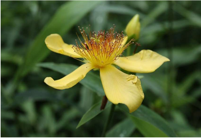
トモエソウ(巴草): オトギリソウ科 6月末～7月末(7月5日)