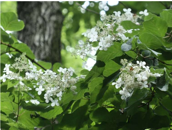
ノリウツギ(糊空木): アジサイ科 6月中～7月中(6月25日)