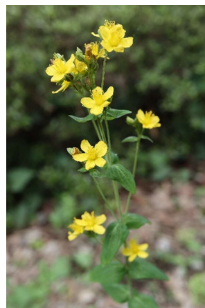
オトギリソウ(弟切草): オトギリソウ科 7月初～8月初(7月13日)