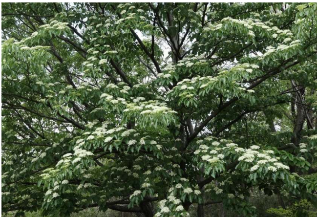
ミズキ(水木): ミズキ科 4月末～5月末(年4月23日)