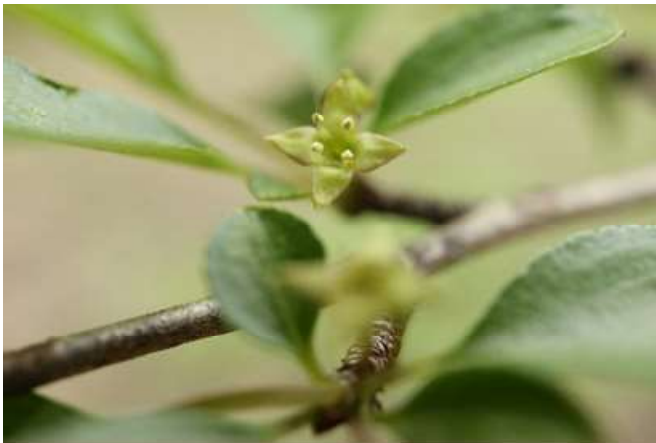
カウモトギ(黒梅擬): カウモトギ科 4月初～4月末(4月12日)