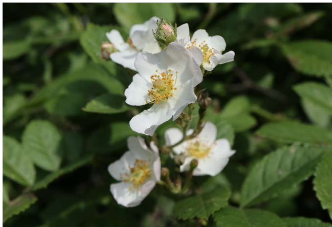
ノイバラ(野茨): バラ科 5月初～6月初(5月10日)