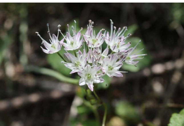
ノビル(野蒜): ヒガンバナ科 6月初～6月末(6月6日)