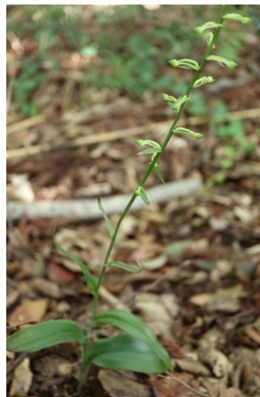
オオハトシホソウ(大葉蜻蛉草): ラン科 6月末～7月末(6月25日)