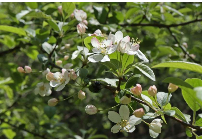
ズミ(酸実): バラ科 4月初～4月末(4月18日)