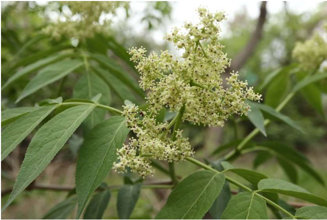
ニワトコ(接骨木): スイカズラ科 4月初~4月末(4月2日)