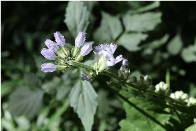
アキノタムラソウ(秋の田村草): シソ科 7月末～10月末(7月26日)