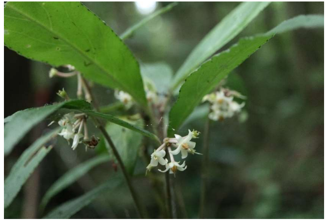
カラタチバナ(唐橘): サクラソウ科 7月初～7月中(7月5日)