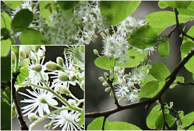
サワフダギ(沢蓋木): ハイノキ科 5月初～5月中(5月5日)