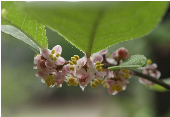
ウメモドキ(梅擬): モチノキ科 5月末～6月中(6月1日)