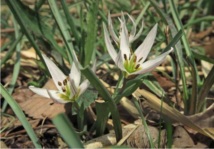
アマナ(甘藷):ユリ科 3月中~4月初(3月20日)