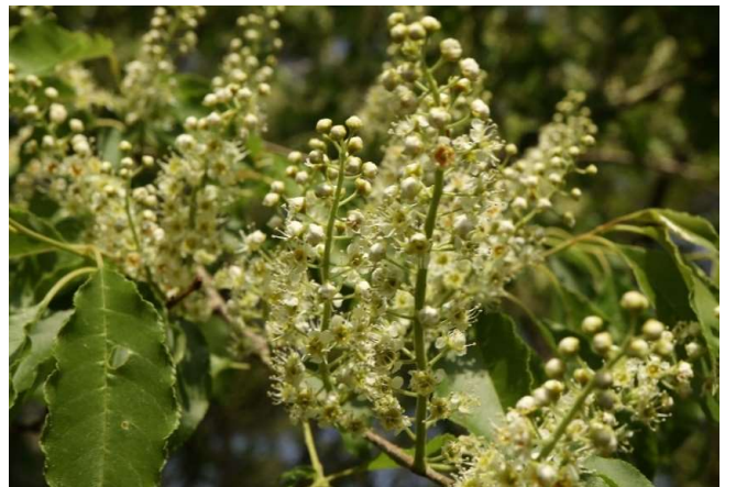
イヌザクラ(犬桜): バラ科 4月中～5月中(4月23日)