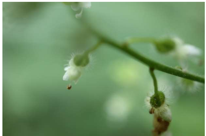
ミズタマソウ(水玉草): アカバナ科 8月初～8月末(8月21日)