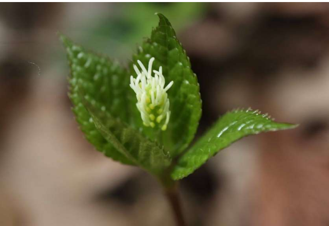
ヒトリシズカ(一人静): センリョウ科 4月末～5月中(4月23日)