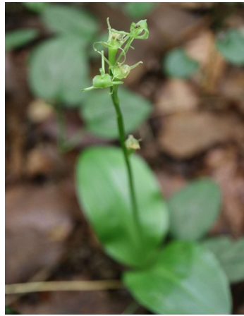
タケシマラン(竹縞蘭): ユリ科 6月末～7月中(6月25日)