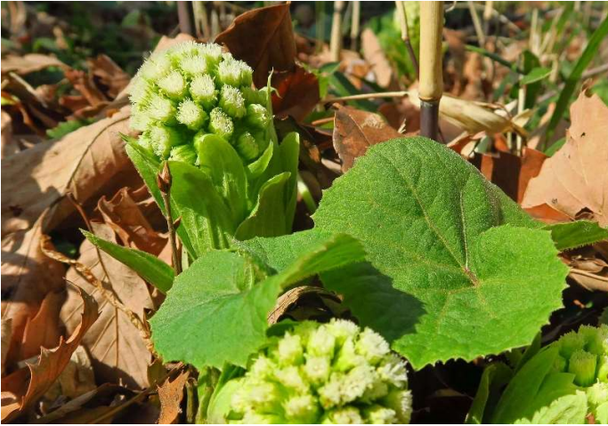
フキ(蓴):キク科 3月中~3月末(3月20日)