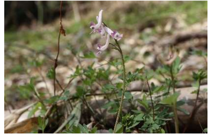
ジロボウエンゴサク(次郎坊延胡索): ケシ科 4月初~4月末(4月5日)