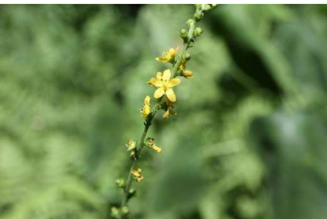
キンミズヒキ(金水引): バラ科 7月中～8月末(7月26日)