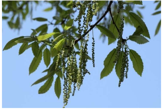
クスギ(樟): ブナ科 4月中～4月末(4月23日)