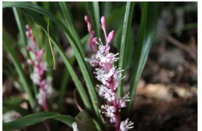
キチジョウソウ(吉祥草): スズラン亜科 10月末～11月初 (10月26日)