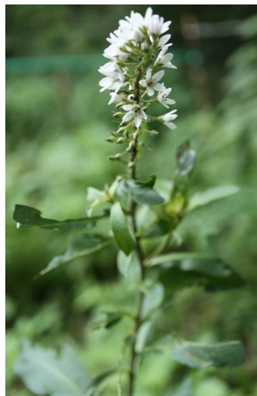
イヌヌトラノオ(犬沼虎の尾): サクラソウ科 6月末～7月中(7月5日)