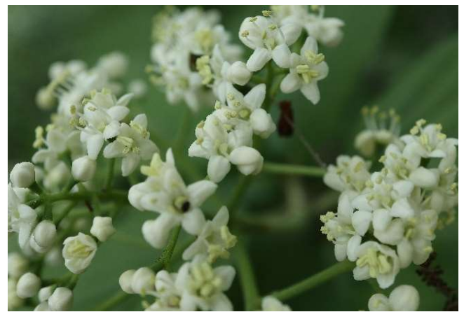
ゴマギ(胡麻木): スイカズラ科 4月末～5月末(5月10日)