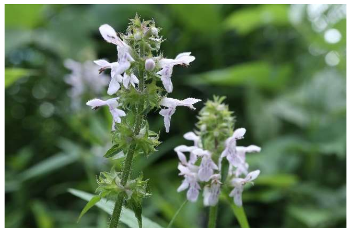
イヌゴマ(犬胡麻): シソ科 7月中～8月初(7月26日)