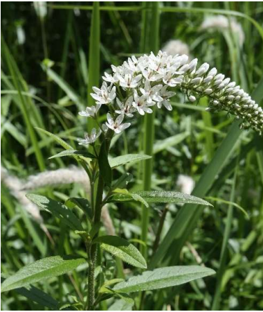
ノジトラノオ(野路虎の尾): サクラソウ科 6月中～7月中(6月20日)