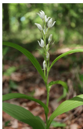
ササバギンラン(笹葉銀蘭): ラン科 4月末～5月中(5月5日)