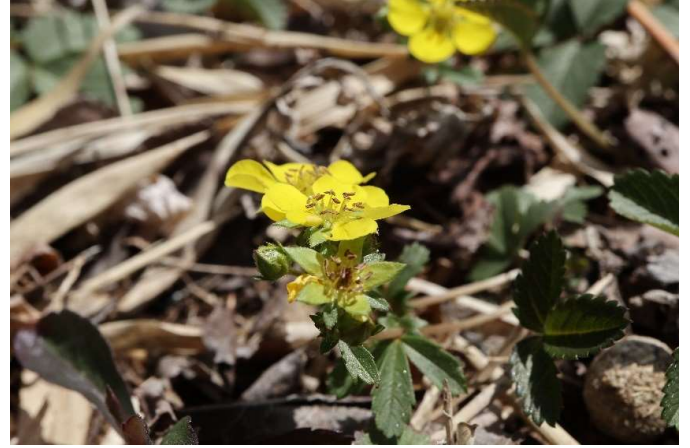
ミツバツチグリ(三葉土栗): バラ科 4月初~4月末(4月5日)