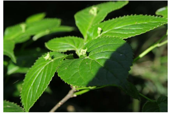
ハナイカダ(花筏): ミズキ(ハナイカダ)科 4月末～5月末(5月10日)