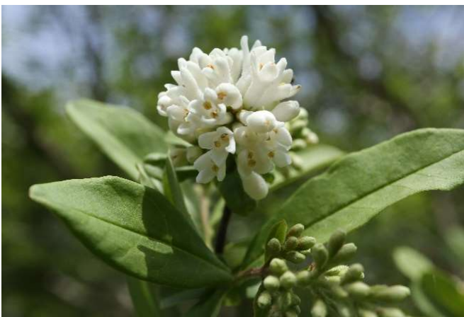
イボタノキ(水蠟樹): モクセイ科 5月初～5月末(5月3日)