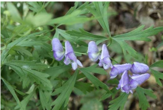
ツバキカブト(筑波烏兜): キンボウゲ科 10月中～10月末(10月22日)