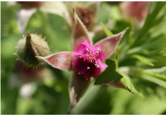
ナワシロイチゴ(苗代苺): バラ科 5月末～6月末(6月1日)