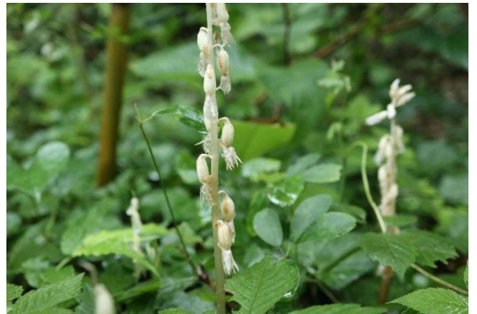
タシロラン(田代蘭): ラン科 7月初～7月中(7月13日)