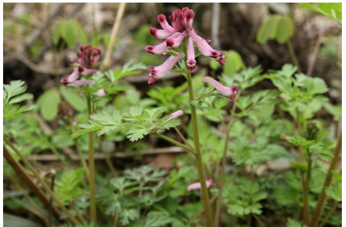
ムラサキケマン(紫華鬘): ケシ科 4月初～4月末(4月12日)