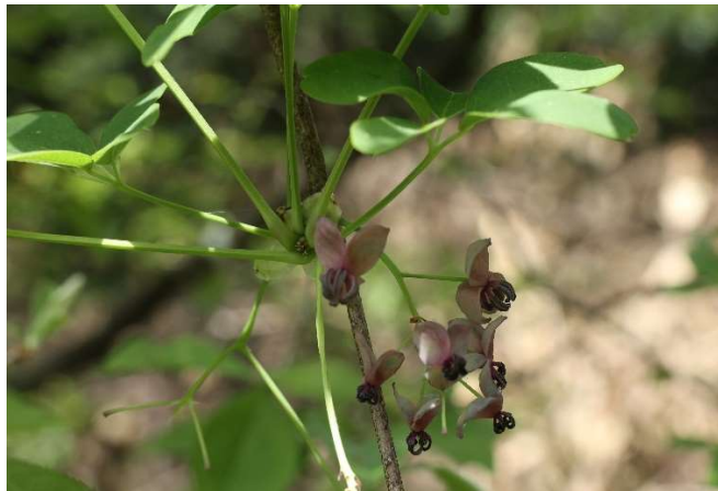
アケビ(木通): アケビ科 4月中～5月中(4月29日)