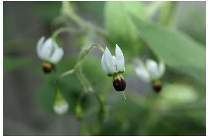
ヒヨドリジョウゴ(鶴上戸): ナス科 8月末～10月中(9月6日)