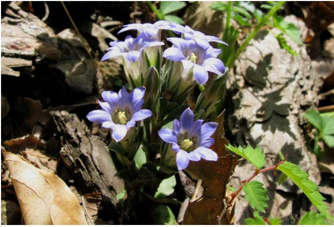
フデリンドウ(筆竜胆): リンドウ科 4月末～5月中(4月29日)