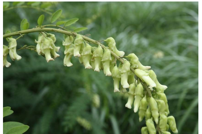
クララ(眩草): マメ亜科 5月末～6月末(6月1日)