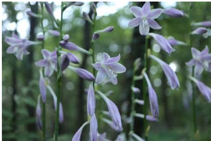
コバギボウシ(小葉擬宝珠): リュウゼツラン亜科 7月末～8月末(7月31日)