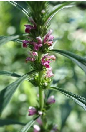
メハジキ(目弾き): シソ科 9月初～9月末(9月6日)