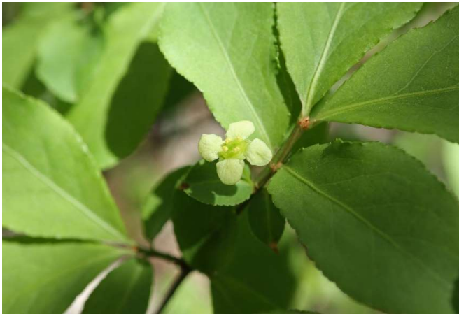
コマユミ(小真弓): ニシキギ科 4月初～5月初(4月5日)