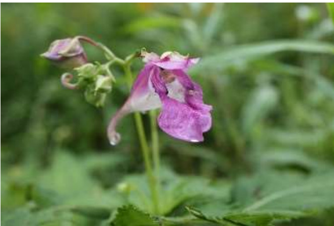
ワタラセツリフネソウ(渡良瀬釣船草) 9月初～9月末(9月19日) ツリフネソウ科