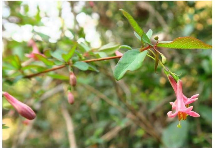
ウグイスカグラ(鶯神楽):スイカズラ科 3月初~4月初(3月20日)