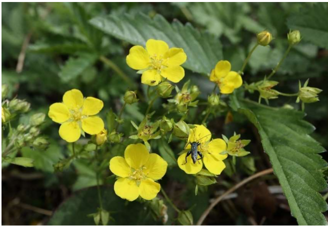
キジムシロ(雉薔):バラ科 4月中～5月初(4月23日)