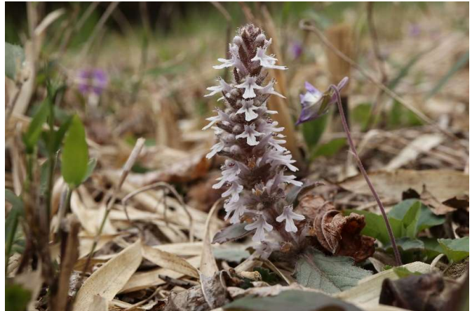
ジュウニヒトエ(十二単衣): シソ科 4月初～5月中(4月18日)