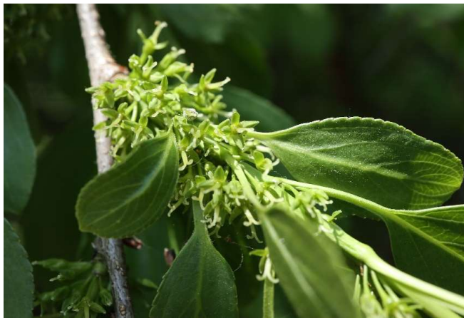
クロツバラ(黒ツ薔薇): クロウメモドキ科 4月末～5月末(5月10日)