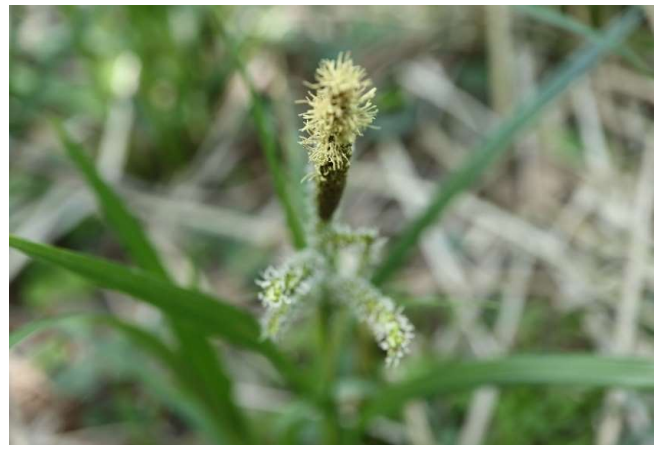
カサスゲ(笠菅): カヤツリグサ科 4月中～5月中(4月29日)