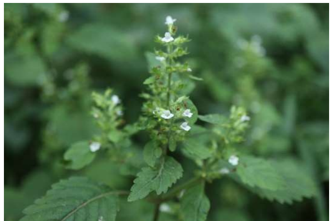
イヌトウバナ(犬搭花): シソ科 7月末～9月末(7月31日)