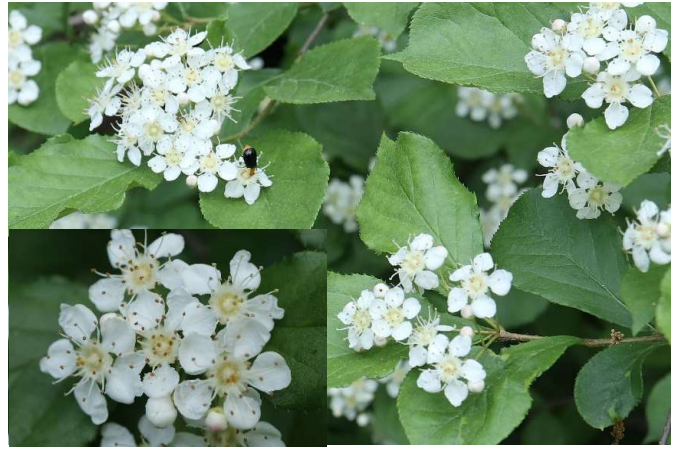
カマツカ(鎌柄): カマツカ科 5月初～5月中(5月5日)