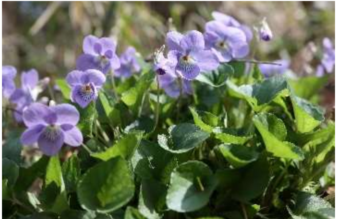
タチツボスミレ(立坪堇): スミレ科 3月中~4月末(4月5日)