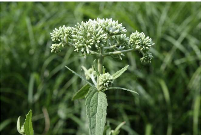
ヒドリバナ(鶺鴒花): キク科 7月末～9月末(7月31日)