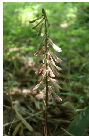
サイハイラン(采配蘭): ラン科 5月初～6月初(5月16日)