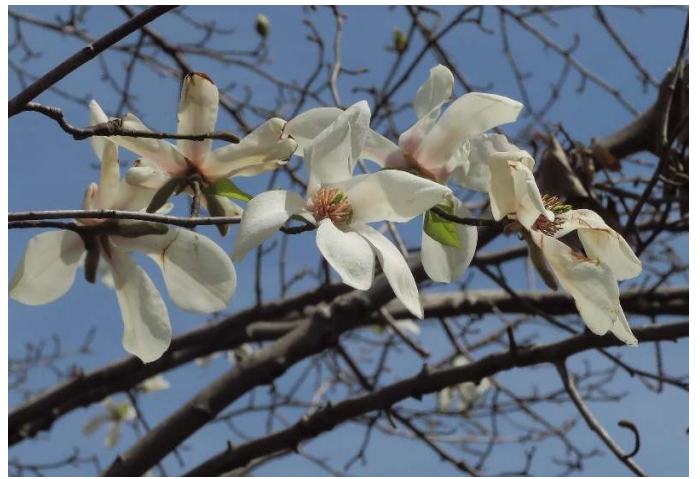
コブシ(辛夷): モクレン科 3月初~4月初(3月22日)