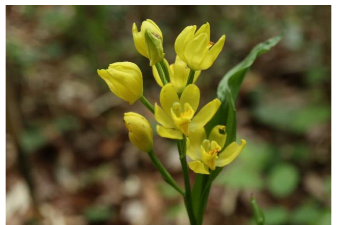
キンラン(金蘭): ラン科 4月中～5月中(4月29日)