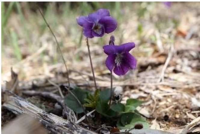
ニオイタチボスマレ(匂立坪堇): スミレ科 4月初~4月末(4月5日)