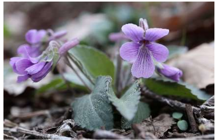
アカネスマレ(茜堇): スミレ科 4月初~4月末(4月5日)