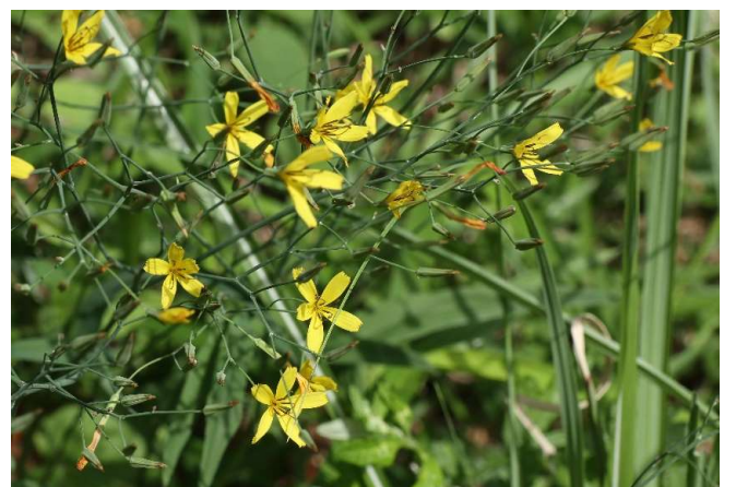
ニガナ(苦菜): キク科 5月中～6月末(5月22日)