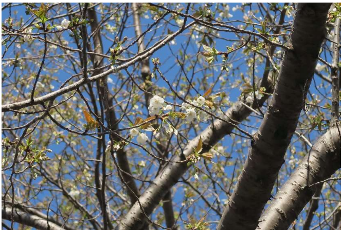
オシマザクラ(大島桜): バラ科 3月末~4月中(4月2日)