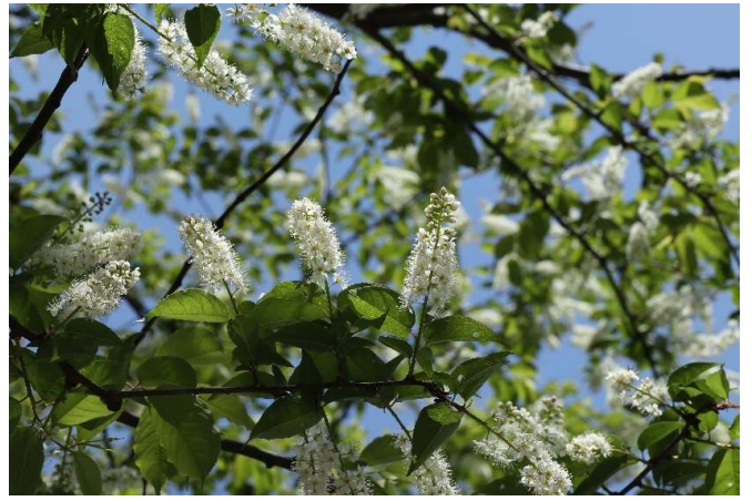
ウラミズザクラ(上溝桜): バラ科 4月中～4月末(4月23日)