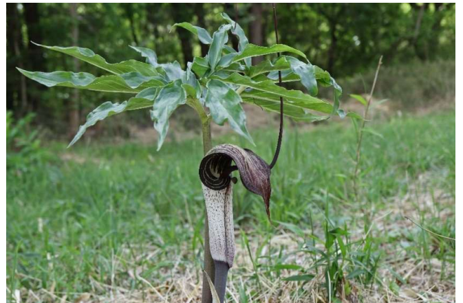
ウラシマソウ(浦島草): サトイモ科 4月中～4月末(4月23日)