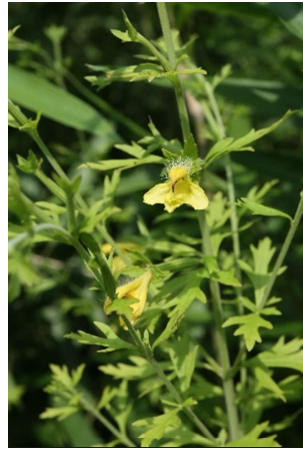
ヒキヨモギ(引蓬): ハマウツボ科 7月末～8月中(7月31日)