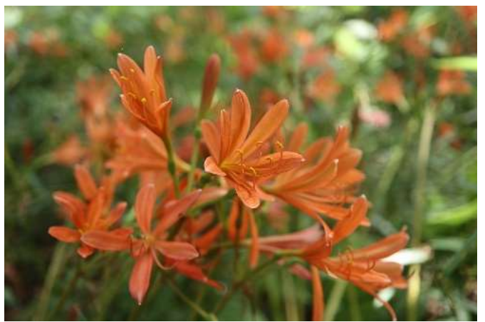
キツネノカミソリ(狐の剃刀): ヒガンバナ科 8月中～8月末(8月21日)