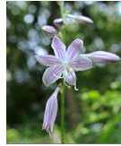
コバキボウシン(小葉擬宝珠) C3, F1, G1, G2 7月27日~8月29日