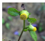
ガンキボソウ(雁首草) B1, C4 8月7日~9月7日