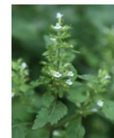
イトワバナ(大搭花) B5, C5 (19年7月21日~8月7日)