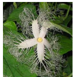
カラスウリ(烏瓜) A1, B2 7月27日~8月29日