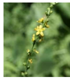
キンミズヒキ(金水引) B2, C4, C5 7月27日~9月27日