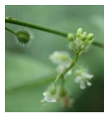
ミズタマソウ(水玉草) B1, C1, G1 8月16日~9月6日