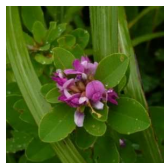
マルバキハギ(丸葉萩) B5, C5 6月25日~9月19日