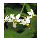
ヒョドリジヨウゴ(鴨上戸) B1 8月29日~9月27日