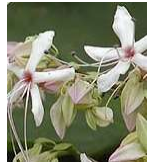
クサギ(臭木) C5 7月27日~8月27日