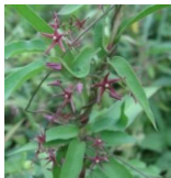
コバノコマル(小葉の鷓鴣) B1, C3 確認できず