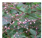
ヌスビトハギ(盗人萩) C3, C5 8月7日~9月19日