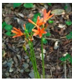
キツネノカミシ(狐の刺刀) B2, F2, G1, G2 8月2日~8月29日