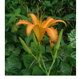
ノカンブウ(野萱草) C4, H6 7月16日~8月2日