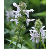
イヌゴマ(犬胡麻) H6 7月16日~10月1日