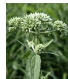
ヒョドリバナ(鴨花) B4, B5 8月7日~9月19日