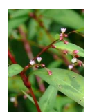
ホントカタ(凡籬蓼) C2 8月7日~8月29日