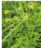
ヒキヨモギ(引蓬) B4 確認できず