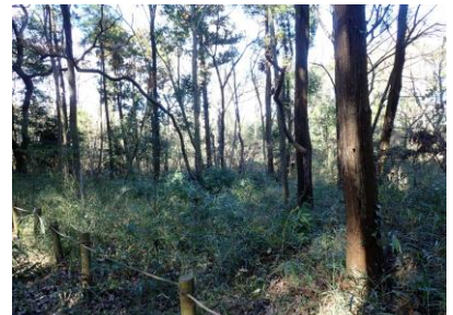
伐採後 森が明るくなりました。