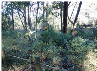
成木を伐採 里山班のご協力を得ました。